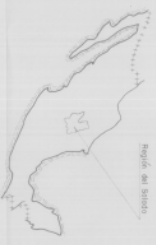
Mapa de México